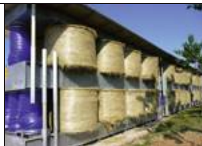
[ Il sistema di disidratazione Clim air.

rotazione e quindi l'operatore può scegliere la modalità di lavoro più idonea al rispetto della struttura dell'alimento. Clim Air ha installato un essiccatoio